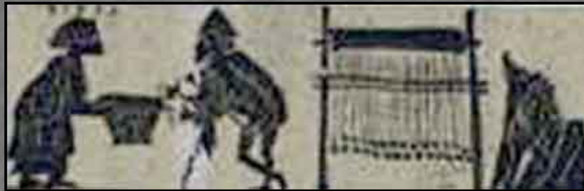
Οδυσσέας και Κίρκη (παράσταση από αγγείο)

Στην Οδύσσεια η μάγισσα Κίρκη συμβουλεύει τον Οδυσσέα να πάει στα παλάτια του Άδη και να πάρει χρησμό από τον τυφλό μάντη Τειρεσία, πώς θα γυρίσει στην πατρίδα του την Ιθάκη.