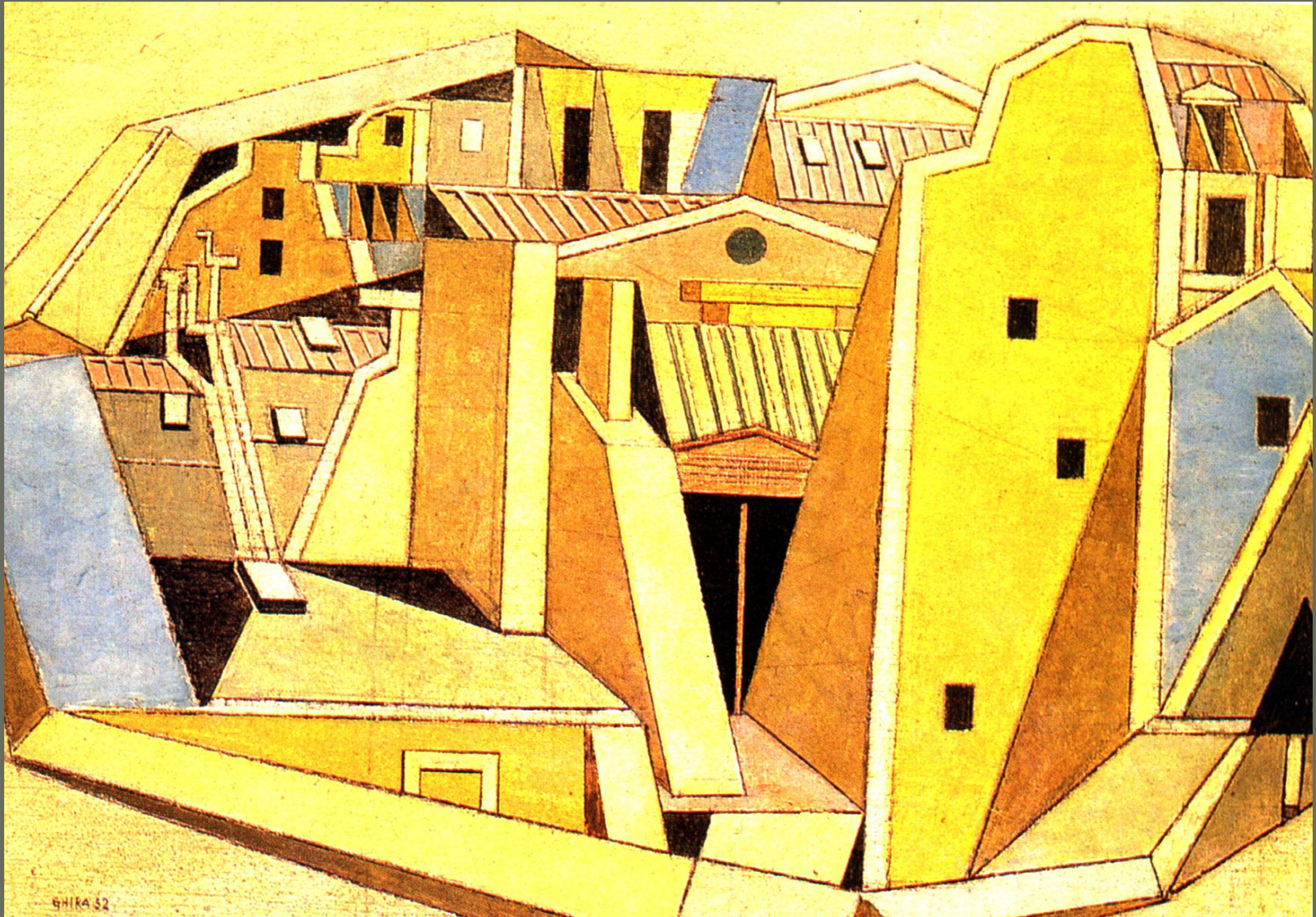
Παρισινές στέγες: Ν. Χαντζηκυριάκου Γκίκα Ζωγραφίστηκε το 1952