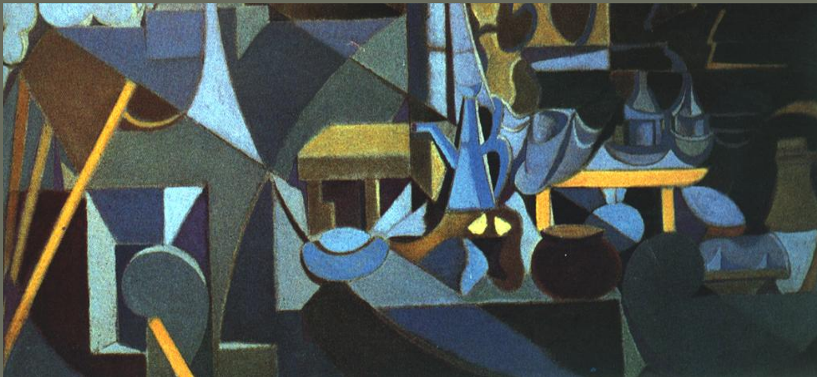
Νεκρή φύση: Ν. Χαντζηκυριάκου Γκίκα