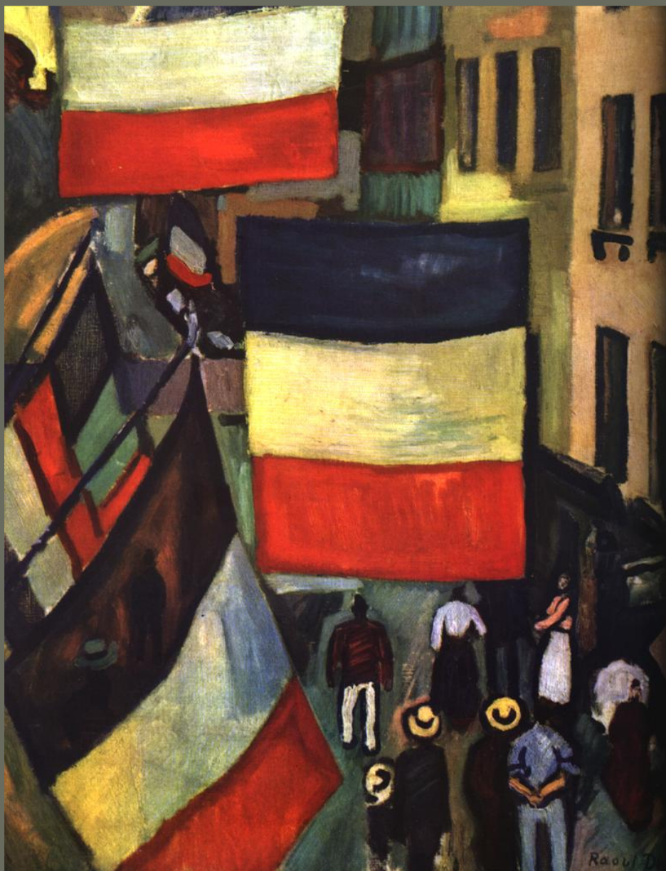
Ο σημαιοστολισμένος δρόμος: Ραούλ Ντυφύ Ζωγραφίστηκε το 1900