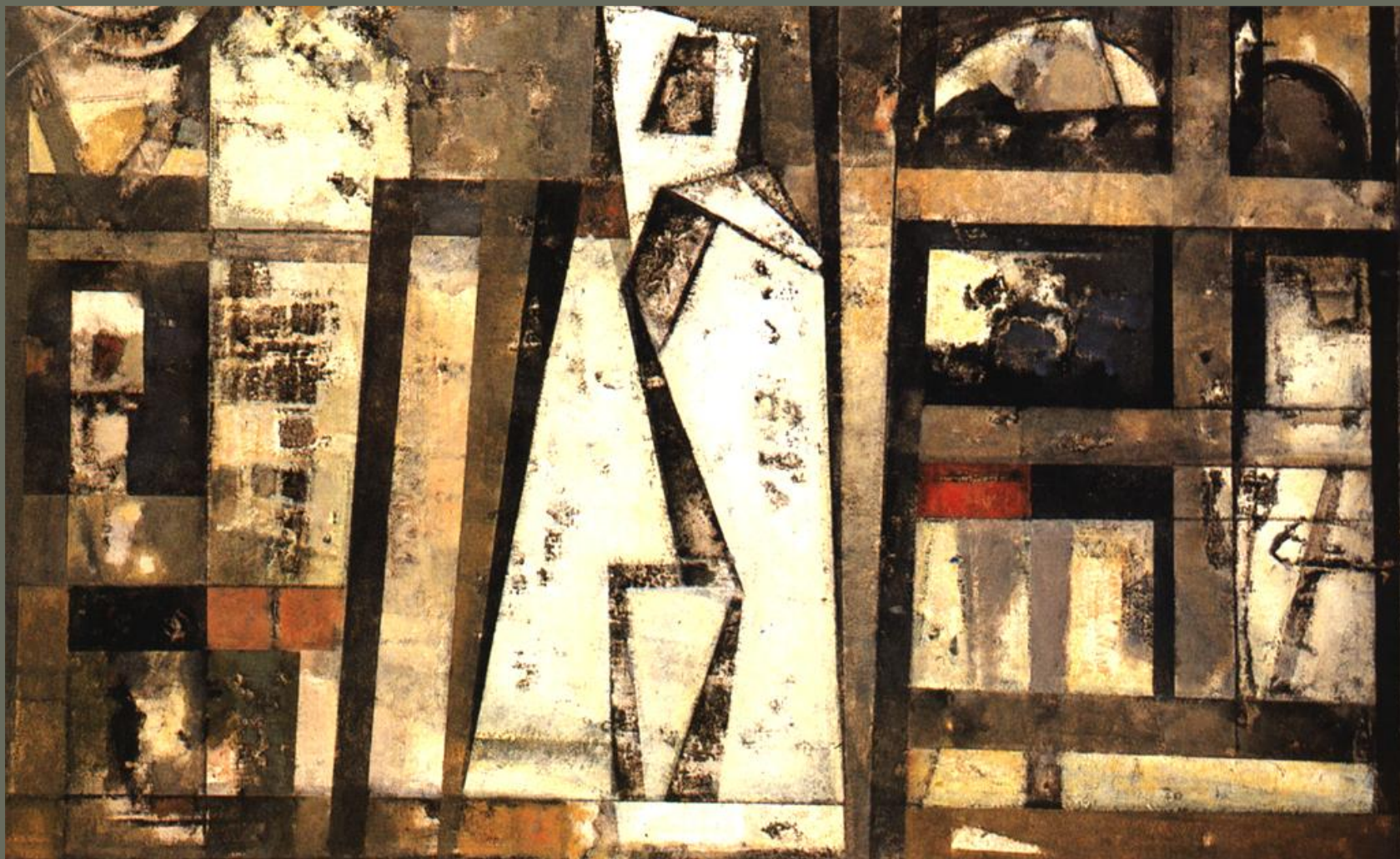
Σύνθεση απ' τη Μύκονο: Γ. Σπυρόπουλου Ζωγραφίστηκε το 1956 Μέγεθος: 70 X 110 εκ.