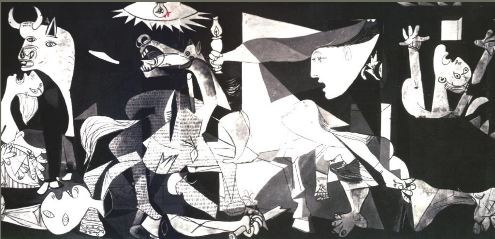
Γκουέρνικα: Πάμπλο Πικάσο Ζωγραφίστηκε το 1937 Μέγεθος: 3,5 X 7,8