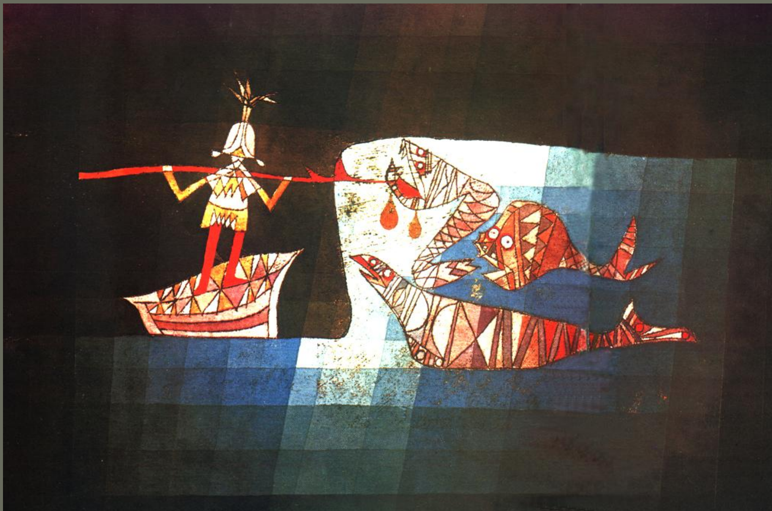
Σεβάχ ο θαλασσινός: Πάουλ Κλέε Ζωγραφίστηκε το 1923 Μέγεθος 38 X 52