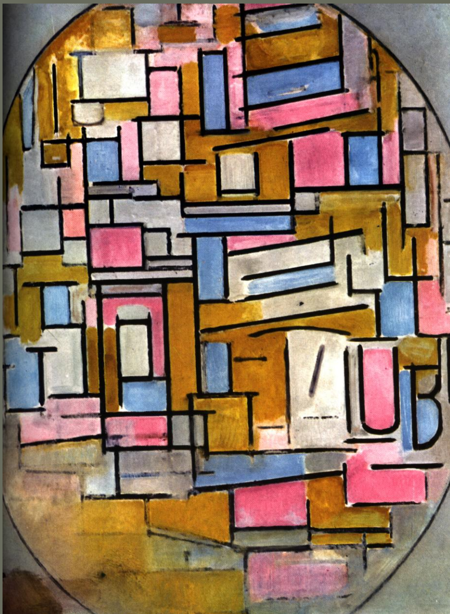
Σύνθεση σε ωειδές σχήμα: Πιέτ Μόντριαν Ζωγραφίστηκε το 1911 με 1914