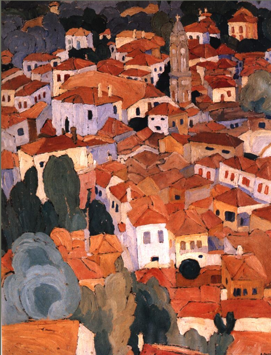
Κόκκινες στέγες στη Λέσβο: Σ. Παπαλουκά